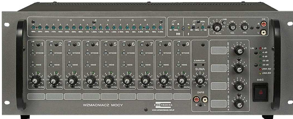
WM-10506 przód wyk. standard